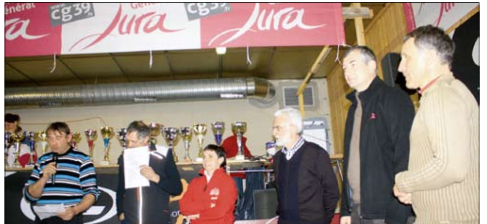
Organisateurs et élus au moment de la remise des prix.