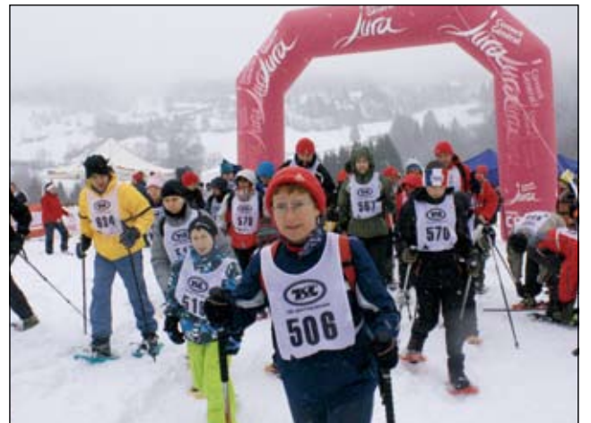
Départ de la « Rando »