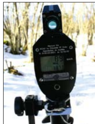
Le radar jumelle qui indique la vitesse contrôlée.