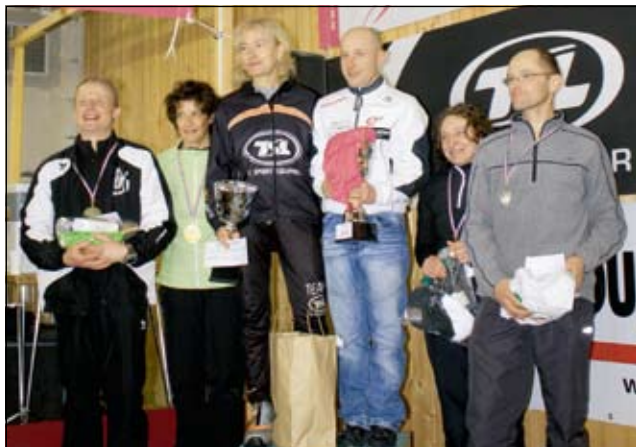
Podium scratch hommes et dames des 12 km.