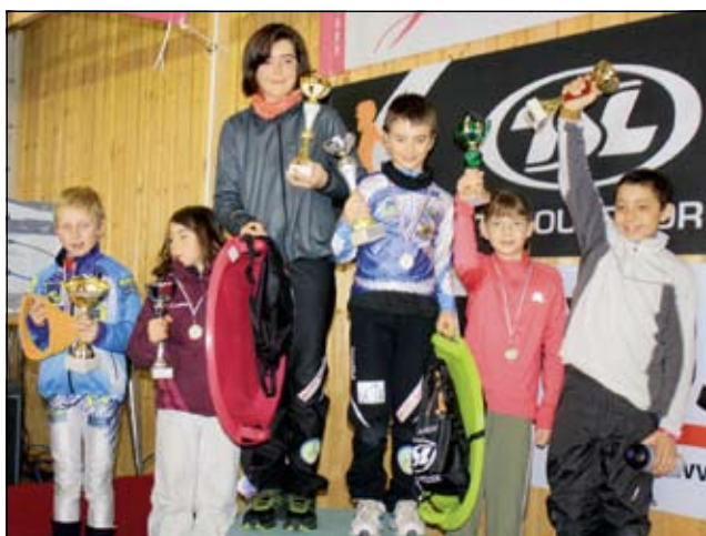
Podium des jeunes poussins et poussines.