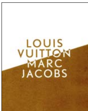
Carton d'invitation de l'exposition