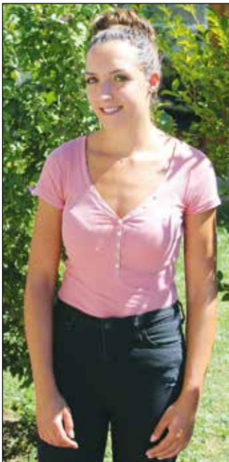
S.H. Photo S.D.-R.