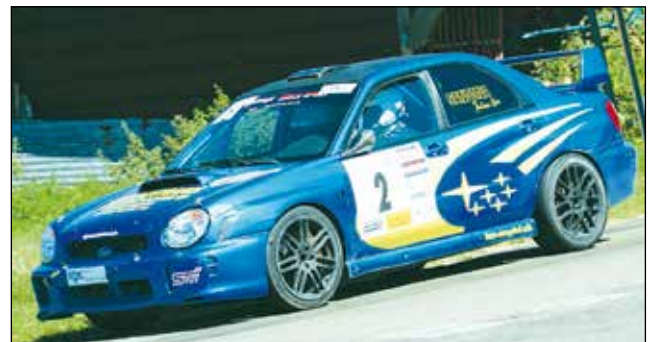
Julien Sandona / Gérald Fournier, 2 e du classement scratch.

copiloté par Elise Conti abandonnait eux aussi sur sortie de route.