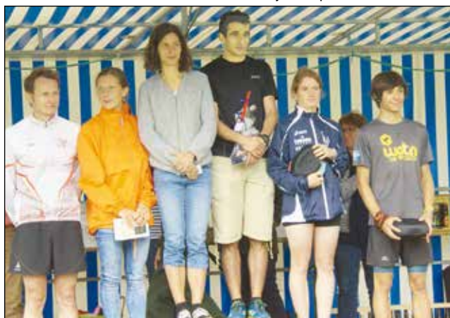
Podium scratch, hommes et dames.