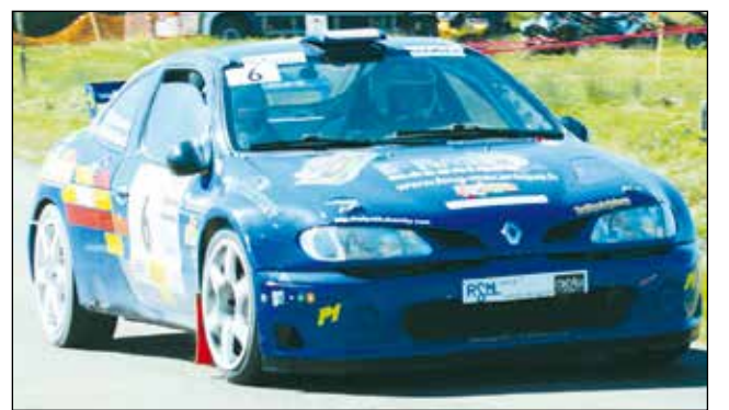
Fabien Frobert / Cédric Liévin, 3 e du classement scratch.