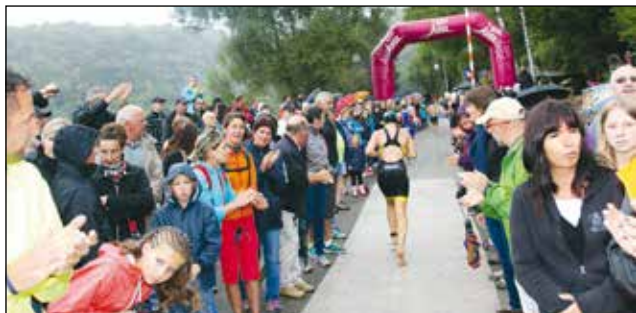
Beaucoup de monde à la sortie de l'eau des nageurs, près du bateau «Le Louisiane».