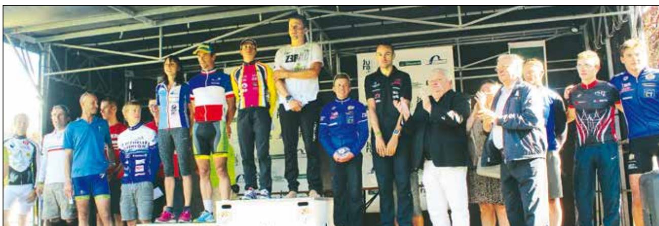
Les 15 premiers du scratch entourés des personnalités et des organisateurs.